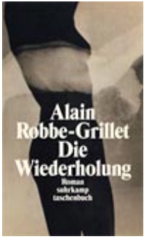
Alain Robbe-Grillet Die Wiederholung