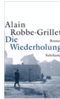
Alain Robbe-Grillet Die Wiederholung