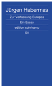
Jürgen Habermas Zur Verfassung Europas