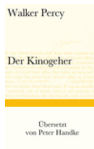
Walker Percy Der Kinogeher