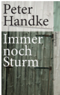
Peter Handke Immer noch Sturm