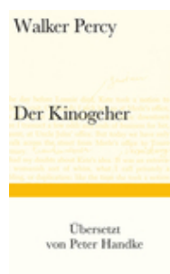
Walker Percy Der Kinogeher