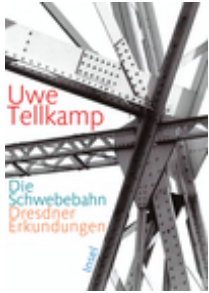
Uwe Tellkamp Die Schwebebahn