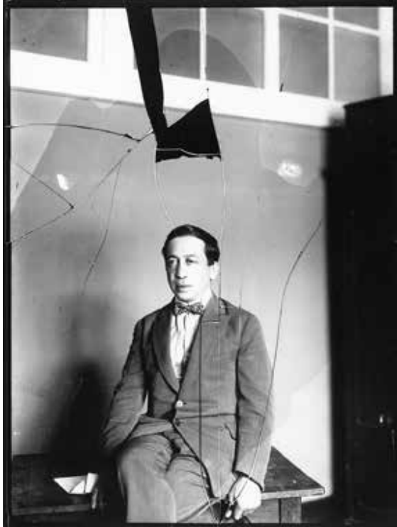
Abb. 1: Siegfried Kracauer in den 1920er Jahren. (Abzug vom zerbrochenen Glasnegativ)