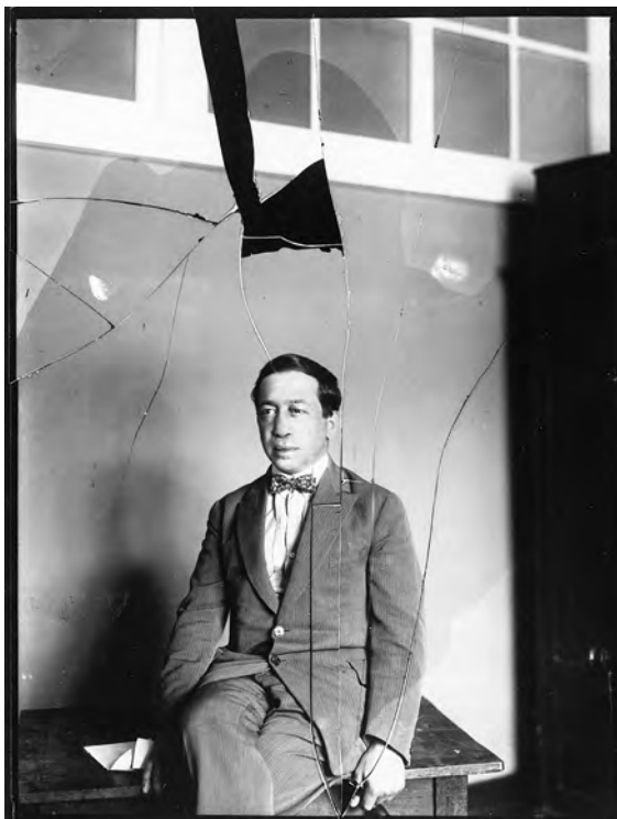
Abb. 1: Siegfried Kracauer in den 1920er Jahren. (Abzug vom zerbrochenen Glasnegativ)