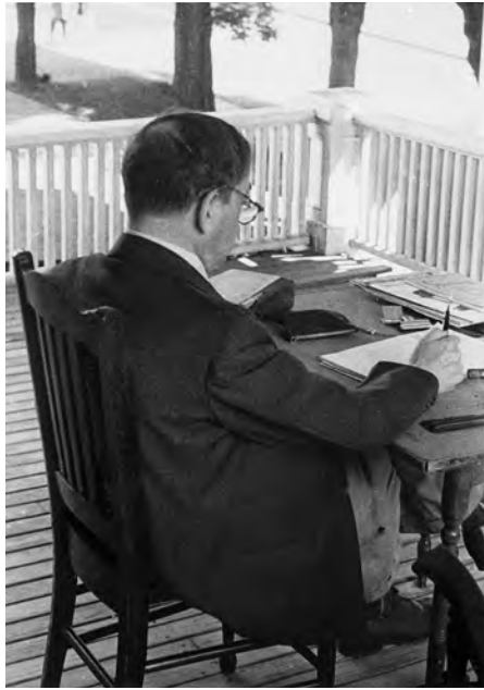
Abb. 2: Siegfried Kracauer in Stamford, New York, 1950.