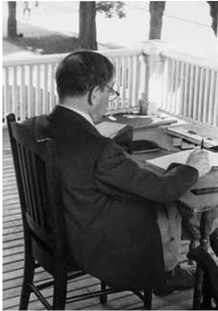
Abb. 2: Siegfried Kracauer in Stamford, New York, 1950.