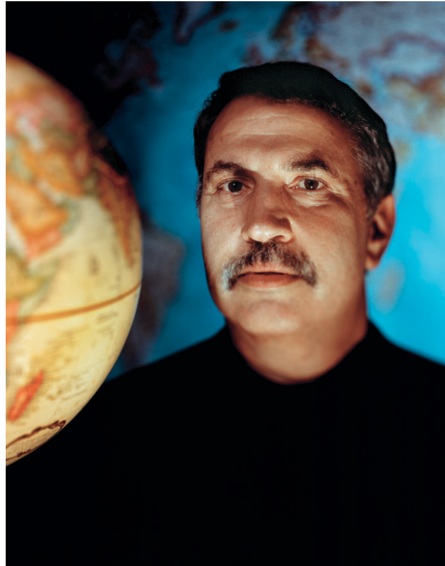
«Die Welt ist flach», sagt Thomas Friedman, der Globus in seiner Hand gehörte eigentlich in den Papierkorb.

Was wäre nötig für einen grossen Schritt? Schaut man sich die Länder an, die auf dieser globalen Plattform vorankommen, dann sind vor allem drei Faktoren entscheidend. Erstens die Infrastruktur,