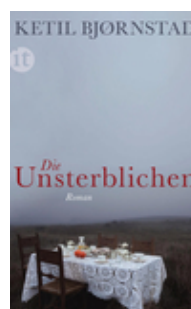
Ketil Bjørnstad Die Unsterblichen