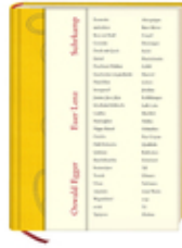
Oswald Egger Euer Lenz