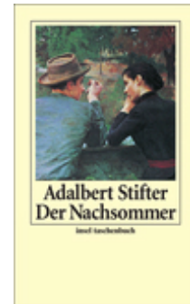
Adalbert Stifter Der Nachsommer