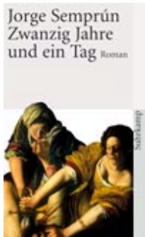
Jorge Semprún Zwanzig Jahre und ein Tag