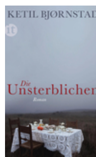
Ketil Bjørnstad Die Unsterblichen