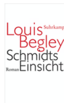
Louis Begley Schmidts Einsicht