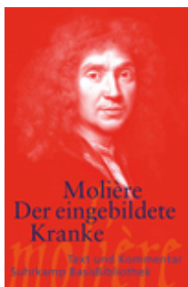
Molière Der eingebildete Kranke