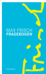
Max Frisch Fragebogen